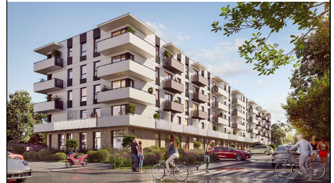
POŁOŻENIE MIESZKANIA W BUDYNKU

UWAGA: NINIEJSZA KARTA KATALOGOWA NIE STANOWI OFERTY W ROZUMIENIU KODEKSU CYWILNEGO. PLAN MIESZKANIA ORAZ POWIERZCHNIE MOGĄ ULEC ZMIANIE W TRAKCIE REALIZACJI BUDYNKU.